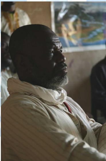
Se contó con el apoyo de la figura religiosa del pueblo, el Imán, que asistió a los talleres de formación.