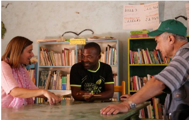
Reunión de los representantes de la asociación con los representantes de la UAH y universidad de Rabat.