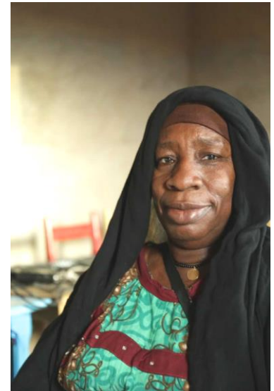
Asistencia de la partera de la localidad a los talleres. Se realizó una entrevista filmada con ella y se intercambiaron impresiones profesionales.