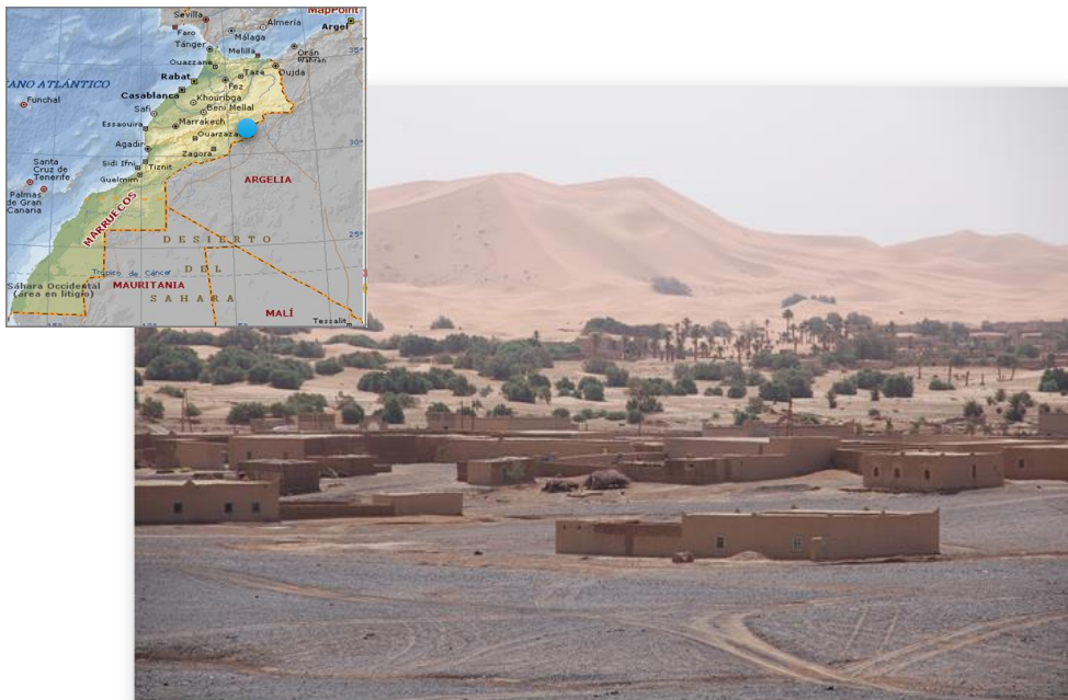
Figura 3. Localización y Vista general del entorno de ERG CHEBBI

Los análisis de aguas realizados en el año 2006 indicaron valores crecientes de contaminación por nitratos en la zona (Vicente et al., 2008). A los datos anteriormente presentados hay que señalar la observación inicial de una falta de gestión de los residuos sólidos urbanos. Por otro lado, si las extracciones siguen aumentando y, superan a la recarga del acuífero, los niveles freáticos continuarán en descenso. Este descenso trae consigo una mayor movilidad de las arenas y el avance de éstas en dirección a los pueblos mencionados, una degradación de los pequeños oasis y, la falta de agua en las khetaras de las poblaciones (Moya Palomares, et al.,2015)