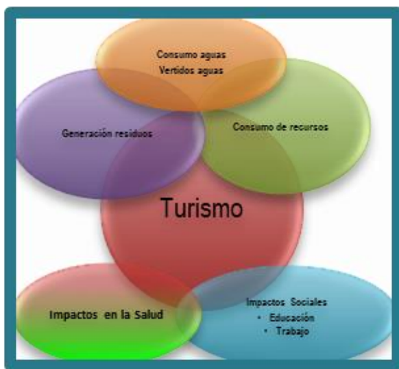
Figura1. Principales problemas identificados

Objetivo General: Difundir conocimientos científicos (naturales, sociales, económicos) para mejorar la sensibilización en temas relacionados con la gestión del territorio, ante la actividad turística y para la protección del entorno y el mantenimiento sostenible de la actividad económica del área Erg Chebbi al del sur de Marruecos (figura 1 y 2).