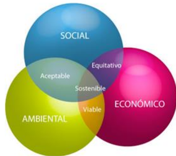
Figura 2. Modelo hacia el que tender con sensibilización y formación