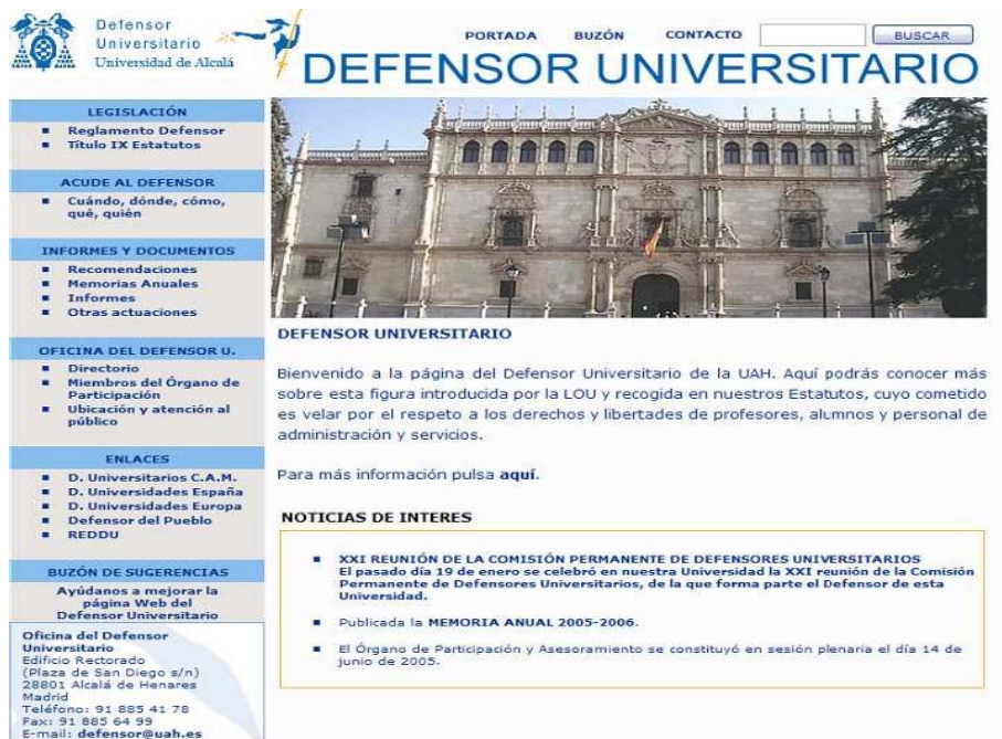
FIGURA 1: PÁGINA DEL DEFENSOR

En la página del Defensor se puede encontrar una parte importante de los documentos generados en su actuación, en particular: